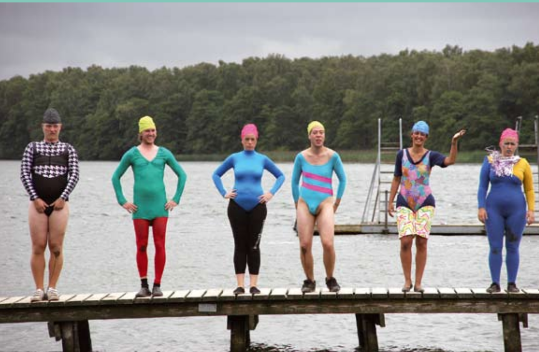
Journalist: Sune Gylling Æbelø

Det tiltagende skydække spejler sig i søens overflade, som kun brydes af en gummibåd, et badende barn og en enlig blishøne. En enkelt midaldrende herre ifører sig bar figur og udfører et hovedspring, men foretager en rap retræte. I samme øjeblik bryder solen nemlig igennem, og frem af bøgeskovens læ dukker en række på syv personer, iført badedragter samt badehætter i ikke matchende kulører. Med ildhu og ihærdighed arbejder de sig – anført af en bademester helt i hvidt og en fanebærer, som af hensyn til fanens sikkerhed er iført redningsvest udenpå badedragten – ned til søen, som de indtager med storm.