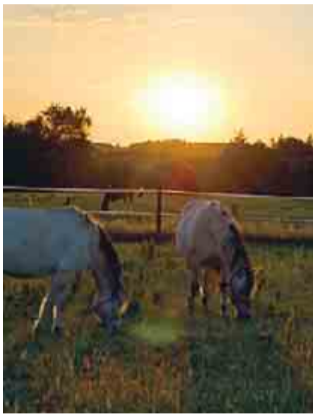
De trofaste heste slapper af i solnedgangen. Privatfoto.

Udsigten er sjældent dårlig fra en hestevogn. Privatfoto.